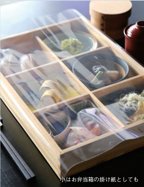
小はお弁当箱の掛け紙としても