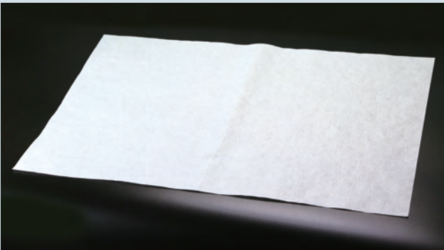
※名入れも承ります。別途お見積りいたします。

■ 抗菌加工製品の抗菌効果は、「JIS Z 2801」において抗菌活性値が2.0以上とすると定められています。