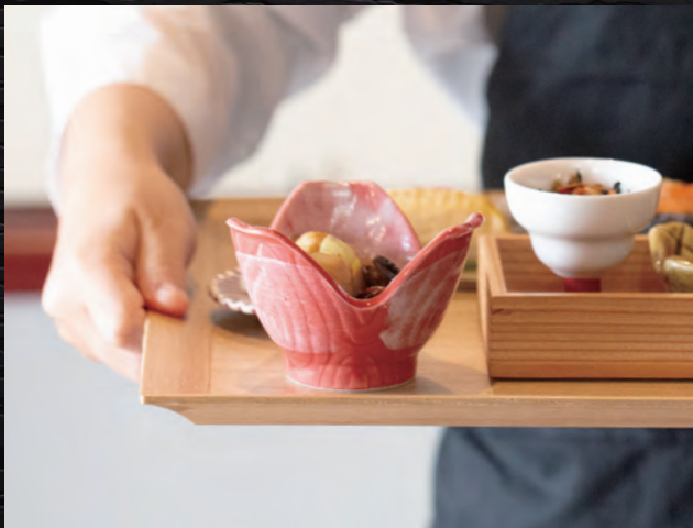
手にフィットする縁の形状で、手がかけやすく、持ち運びしやすい