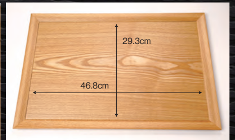
大型サイズで、たくさん配膳可能