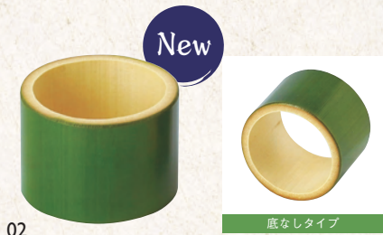
02 青塗丸竹輪切り 02 (25729) 750円 約φ5.2~5.9×H4cm ※ウレタン塗装付

【ご注意】※01,02 天然竹の為、直径に大きくバラツキがございます。 ※底がありませんので器としての使用には適していません。