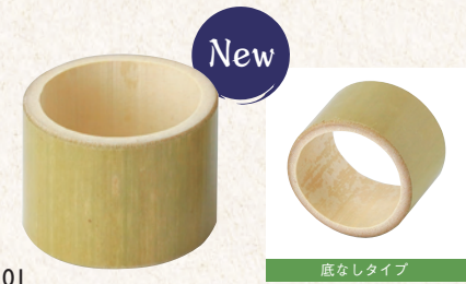
01 丸竹輪切り(無塗装) 01 (22248) 120円 約φ5.2~5.9×H4cm

竹をカットした丸形の仕切です。底なしの筒状仕様で、お値打ちな価格を実現しました。無塗装仕様はワンウェイに、青塗仕様は繰り返し使用に。お弁当やおせち用の仕切としてご利用いただけます。