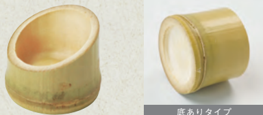
04 ハス切り竹千代口(無塗装) 04 (25741) 240円 約φ6×H4.5(2.5)cm