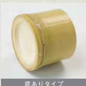
青塗丸竹珍味入 05 (22204) フラット 820円 約φ5.5~6×H4.5cm 06 (22205) ハス切り 820円 約φ5.5~6×H4.5(2.5)cm ※ウレタン塗装付