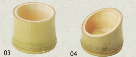
03 丸竹千代口(無塗装) 03 (25740) 240円 約φ6×H4.5cm